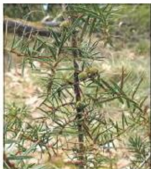
Eerste jonge jeneverbes met bessen. Hero Moorlag

om de dikste bomen te verwijderen. Het resultaat is overweldigend.